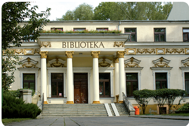
Miejska Biblioteka Publiczna, ul. J. Piłsudskiego 12

trzeby telekomunikacji, a po wyzwoleniu funkcjonowało tu Muzeum Regionalne i Okręgowe. W 1992 r. obiekt przekazano dla Wojewódzkiej Biblioteki Publicznej. Obecnie mieści się tu Miejska Biblioteka Publiczna im. J. i A. Załuskich.