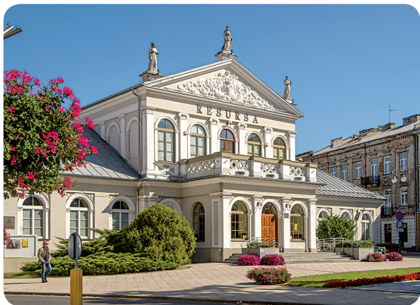
Ośrodek Kultury i Sztuki „Resursa Obywatelska”

Obiekt wzniesiony według projektu Ludwika Radziszewskiego w 1851 r. dla Resursy Obywatelskiej. Organizowano w nim odczyty, bale, przedstawienia teatralne, z których dochód był przeznaczany na prowadzenie, znajdującego się obok, szpitala św. Kazimierza. Przez lata wielokrotnie zmieniało się przeznaczenie budynku. Obecnie ma tu swoją siedzibę Ośrodek Kultury i Sztuki „Resursa Obywatelska”.