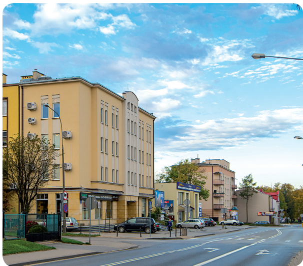
Ulica K. Kelles-Krauza