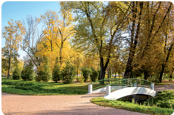
Park Stary Ogród

W okresie przed II wojną światową na skraju parku, przy ulicy Nowospacerowej, znajdowała się (obecnie nieistniejąca) Szkoła Powszechna nr 15 im. Mikołaja Reja. Andrzej Wajda był jej uczniem do 1940 r. Tu również przyszły reżyser wstąpił do 20. Radomskiej Drużyny Harcerskiej, w której został zastępowym.