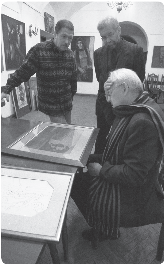
Muzeum Sztuki Współczesnej w Domach Gąski i Esterki, 17 października 2005 r.