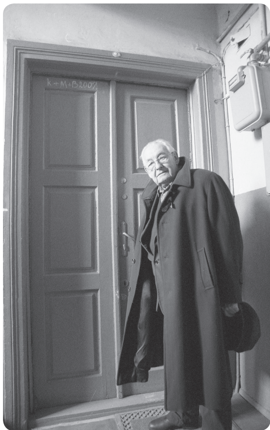
Kamienica oficerska - ul. J. Malczewskiego 20, Andrzej Wajda przed drzwiami do dawnego rodzinnego mieszkania, 23 lutego 2007 r.