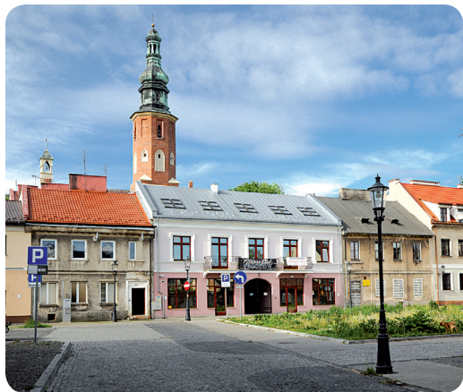
Radomskie motywy malarskie we wczesnej twórczości Andrzeja Wajdy