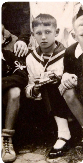
Andrzej Wajda - fragment komunistycznego zdjęcia grupowego

Klasztor oo. Bernardynów od początku swojego istnienia był ważnym ośrodkiem religijnym, a także kultural-