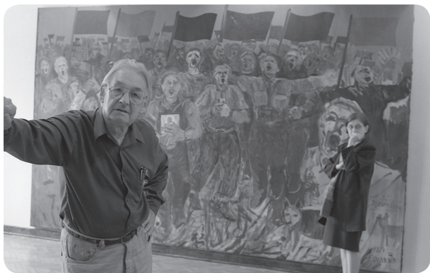
Andrzej Wajda i Krystyna Zachwatowicz na tle obrazu Edwarda Dwurnika, Radom, 13 lipca 1997 r.

28 sierpnia 2000 r. otrzymał tytuł Honorowego Obywatela Radomia.