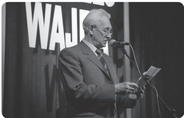
Andrzej Wajda podczas spotkania z mieszkańcami Radomia w Teatrze Powszechnym im. Jana Kochanowskiego, 15 kwietnia 2000 r.

Po wyzwoleniu w budynku uruchomiono Kino „Wisła”. Obecnie, po przebudowie i rozbudowie, siedziba Teatru Powszechnego im. Jana Kochanowskiego.