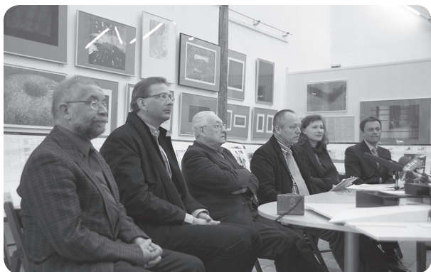
Andrzej Wajda podczas spotkania w MCSW Elektrownia, 23 lutego 2007 r.

19 grudnia 2005 roku sejmik województwa mazowieckiego uchwalił powołanie nowej instytucji kultury - Mazowieckiego Centrum Sztuki Współczesnej Elektrownia w Radomiu. Pierwsza wystawa w budynku elektrowni została otwarta 4 marca 2006 roku. Pokazano na niej fotografie prac przekazanych do kolekcji Muzeum Sztuki Współczesnej przez Andrzeja Wajdę. W ten sposób uczczono 80. urodziny Honorowego Obywatela Radomia, pomysłodawcy i orędownika budowy nowej siedziby kolekcji.