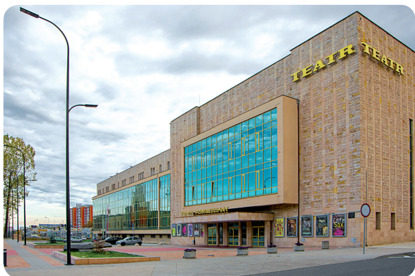
Teatr Powszechny im. Jana Kochanowskiego

2000 r. po otwarciu wystawy „Mój Radom. Nasza Japonia”.