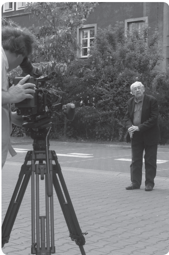
Andrzej Wajda z odzyskaną szablą ojca na tle dawnego domu oficerskiego. 29 maja 2016 r.