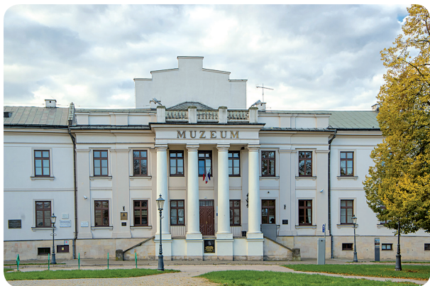
Muzeum im. Jacka Malczewskiego

W latach 1945-1946 do mieszczącego się tu Gimnazjum im. Jana Kochanowskiego uczęszczał Andrzej Wajda. W 1946 r. uczniowie, pod kierunkiem nauczycielki języka polskiego, Elżbiety Jackiewiczowej, wystawili dwa spektakle: „Odnowione tarcze” i „Antygonę”. Oryginalne i pomysłowe dekoracje wykonał Andrzej Wajda. Wiele lat później, budynek dawnego liceum reżyser wykorzystał do plenerów w filmie „Dyrygent”.