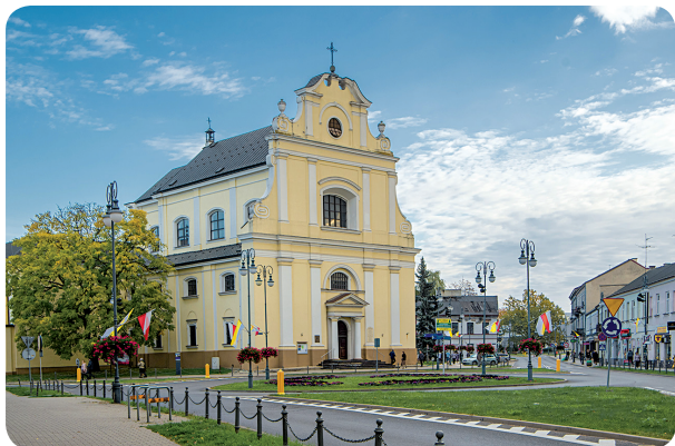
Kościół pw. Świętej Trójcy na Placu Kazimierza Wielkiego

Wiosną 1943 roku Andrzej Wajda wykonał projekt Grobu Pańskiego do tej świątyni. Zrealizowany projekt był wykorzystywany przez kolejne dwa lata. Po sześćdziesięciu latach reżyser powrócił do dawnej realizacji i projekt ten wykorzystał w filmie „Wielki Tydzień”.