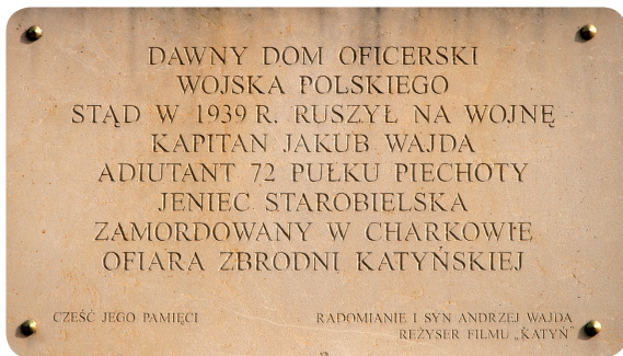
Tablica pamiątkowa na dawnym domu oficerskim przy ul. J. Malczewskiego 20