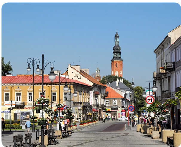
Ulica S. Żeromskiego