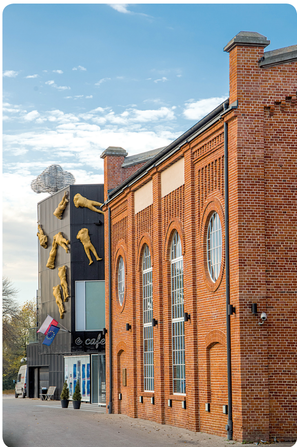
Mazowieckie Centrum Sztuki Współczesnej „Elektrownia”