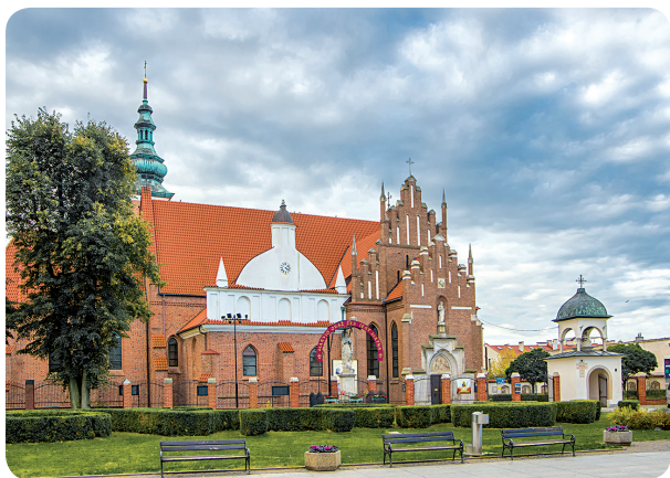
Kościół i klasztor oo. Bernardynów