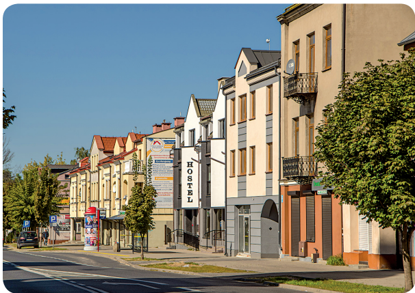
Ulica M. Reja

lickim, z widokiem na wieżę kościoła farnego, utrwalił na akwareli z 1941 r.