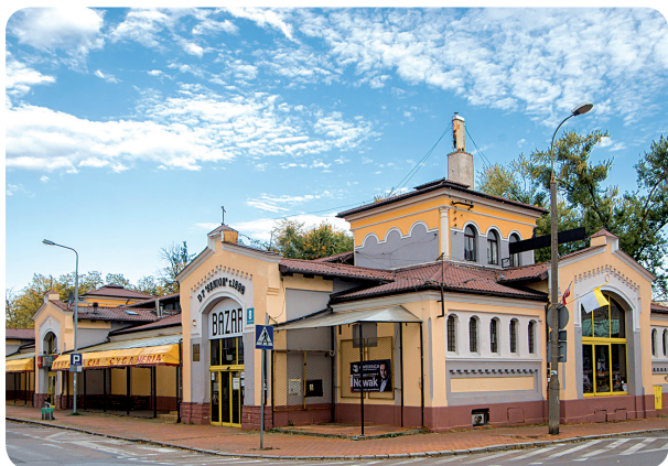
Dom Handlowy Senior - w czasie wojny „Hala targowa”

kapusty. „Piwnice pod halą targową stanowiły moje królestwo” - wspominał reżyser.