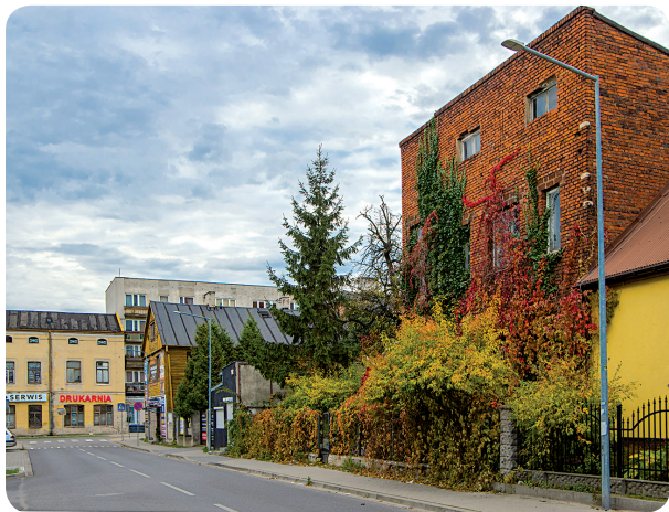
Ulica Czysta, część wschodnia