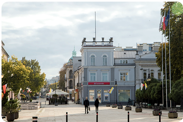
Kamienica Staniszewskich na Placu Konstytucji 3 Maja

Po zakończeniu II wojny światowej, dzięki działalności biblioteki, Radom stał się ważnym ośrodkiem kulturalnym regionu. Andrzej Wajda uczestniczył w licznych wykładach m.in. Tadeusza Kotarbińskiego oraz spotkaniach literackich z Julianem Przybosiem, Jerzym Andrzejew-