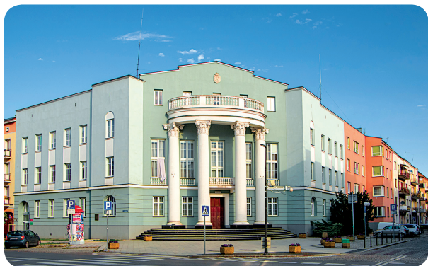
Gmach Dawnego Powiatowego Związku Samorządowego ul. S. Moniuszki 11

Miejsce to Andrzej Wajda odwiedził w 2008 r. Był wówczas gościem radomskich radnych. Przyjechał na sesję rady, aby wyrazić swoje zdanie na temat przyszłości Muzeum Sztuki Współczesnej i zgromadzonej w nim kolekcji sztuki współczesnej.