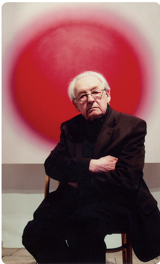
Andrzej Wajda w Muzeum Sztuki Współczesnej w Radomiu. 27 kwietnia 2009 r.