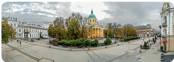
Plac Konstytucji 3 Maja

Centralny plac Radomia, usytuowany przy ul. S. Żeromskiego, na osi ulic: F. Focha i J. Piłsudskiego. Zaprojektowany w 1846 r. na polach uprawnych przy ówczesnym trakcie lubelskim, a zrealizowany w 1875 r. w związku z planowaną budową cerkwi prawosławnej. Zabudowa wokół niego ukształtowała się na przełomie XIX i XX wieku. Wzniesiono tu wówczas jedne z najpiękniejszych kamienic w mieście, m.in. pałac Karschów, dom Staniszewskich oraz cerkiew pw. św. Mikołaja, przemianowaną po odzyskaniu niepodległości na kościół garnizonowy pw. św. Stanisława Biskupa.