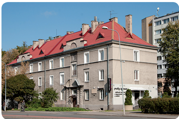
Dawny dom oficerski przy ul. J. Malczewskiego 20