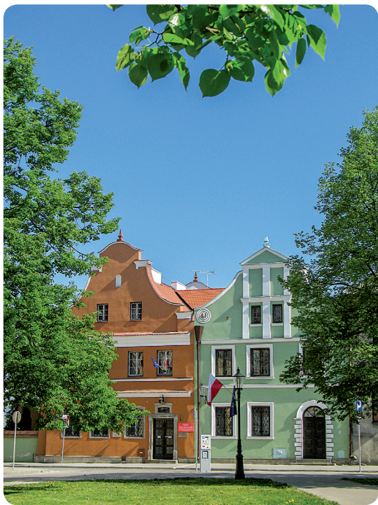
Kamienice Gąski i Esterki

Współczesnej będące oddziałem Muzeum im. Jacka Malczewskiego. Zbiory muzeum stanowią głównie dary od zaprzyjaźnionych artystów. Jedną z największych kolekcji przekazali Krystyna Zachwatowicz i Andrzej Wajda.